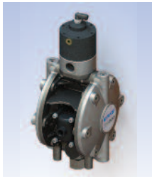
Modèle en acier inoxydable avec chambre de compensation (pour les applications dans lesquelles le filtre cisaille le produit). Référence DX200SP.