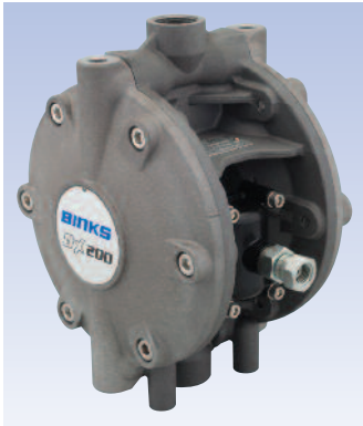
Modèle DX200 sans régulateur avec une sortie produit verticale.

L'équipement de la pompe inclut un accessoire de montage et prévoit un tuyau flexible d'aspiration et un filtre d'aspiration sur l'arrivée verticale inférieure. Le montage sur fût prévoit l'utilisation d'une canne d'aspiration rigide. Le modèle sans régulateur est doté d'une sortie verticale supérieure alors que le modèle à régulateur produit est doté d'une sortie horizontale frontale.