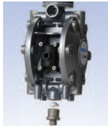
Une gamme de raccords est disponible pour permettre le raccordement entrée/sortie de pompe à différents systèmes de connexion.