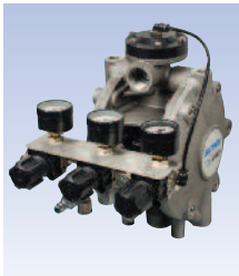
Régulateur produit « intégré » qui permet de réduire les coûts par rapport aux produits de la concurrence.

Le couvercle de protection et les joints des couvertures de valve ne sont entravés par aucun obstacle et peuvent ainsi être démontés à l'aide d'un seul outil, facilitant de la sorte les opérations d'entretien de la pompe quelle que soit sa position.